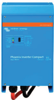
Phoenix Inverter Compact 24/1600

Todos los modelos disponen de un Puerto RS-485. Todo lo que necesita conectar a su PC es nuestro interfaz MK2 (ver el apartado "Accesorios"). Este interfaz se encarga del aislamiento galvánico entre el inversor y el ordenador, y convierte la toma RS-485 en RS-232. También hay disponible un cable de conversión RS-232 en USB. Junto con nuestro software VEConfigure , que puede descargarse gratuitamente desde nuestro sitio Web www.victronenergy.com , se pueden personalizar todos los parámetros de los inversores. Esto incluye la tensión y la frecuencia de salida, los ajustes de sobretensión o subtensión y la programación del relé. Este relé puede, por ejemplo, utilizarse para señalar varias condiciones de alarma distintas, o para arrancar un generador. Los inversores también pueden conectarse a VENet , la nueva red de control de potencia de Victron Energy, o a otros sistemas de seguimiento y control informáticos.