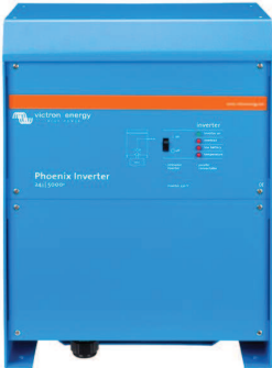
Phoenix Inverter 24/5000